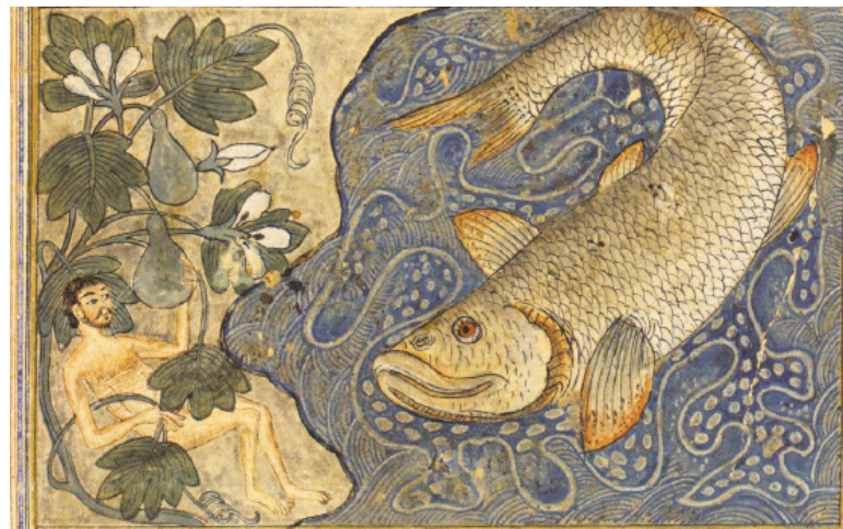
Anónimo. Jonas e a Baleia

Quando nos sentimos amados como pessoas, amparados com afecto e acompanhamento, sabendo que o nosso trabalho interessa, envolve e apaixonava, temos a certeza de existir.